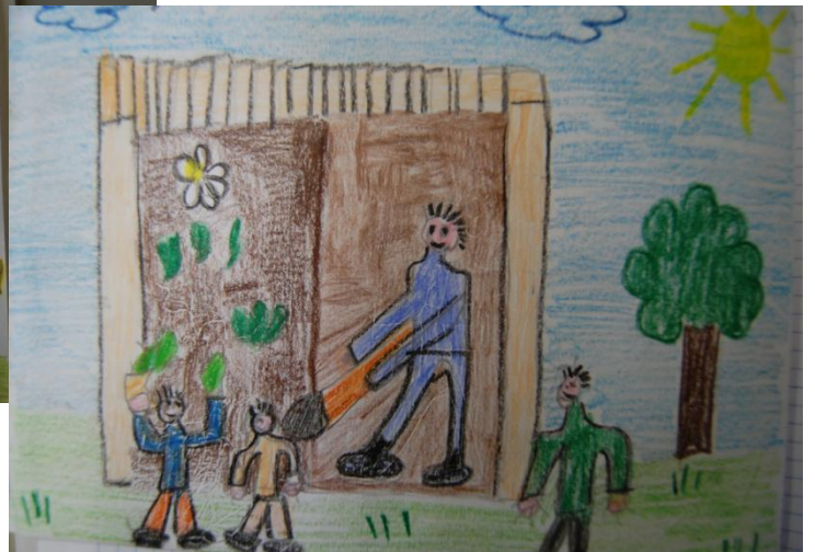
Disegno e testo di Veronica e di Paolo di classe 2 ^